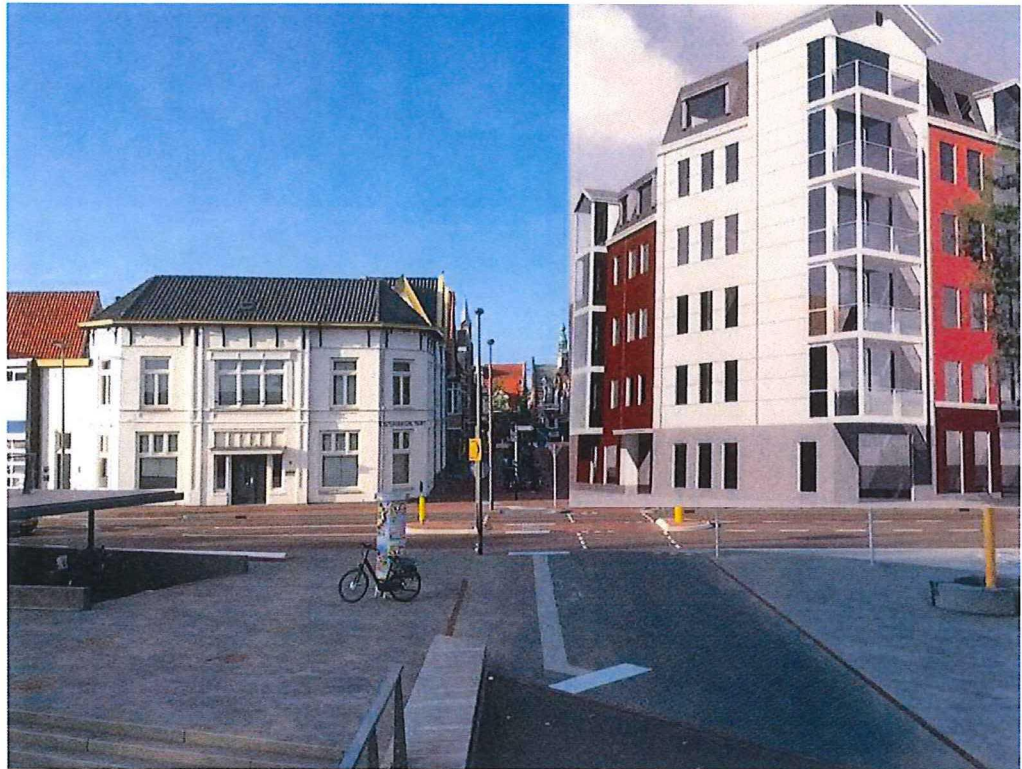
Zelf samengestelde impressie van de nieuwbouw naast het pand “De Amsterdamsche Poort”.