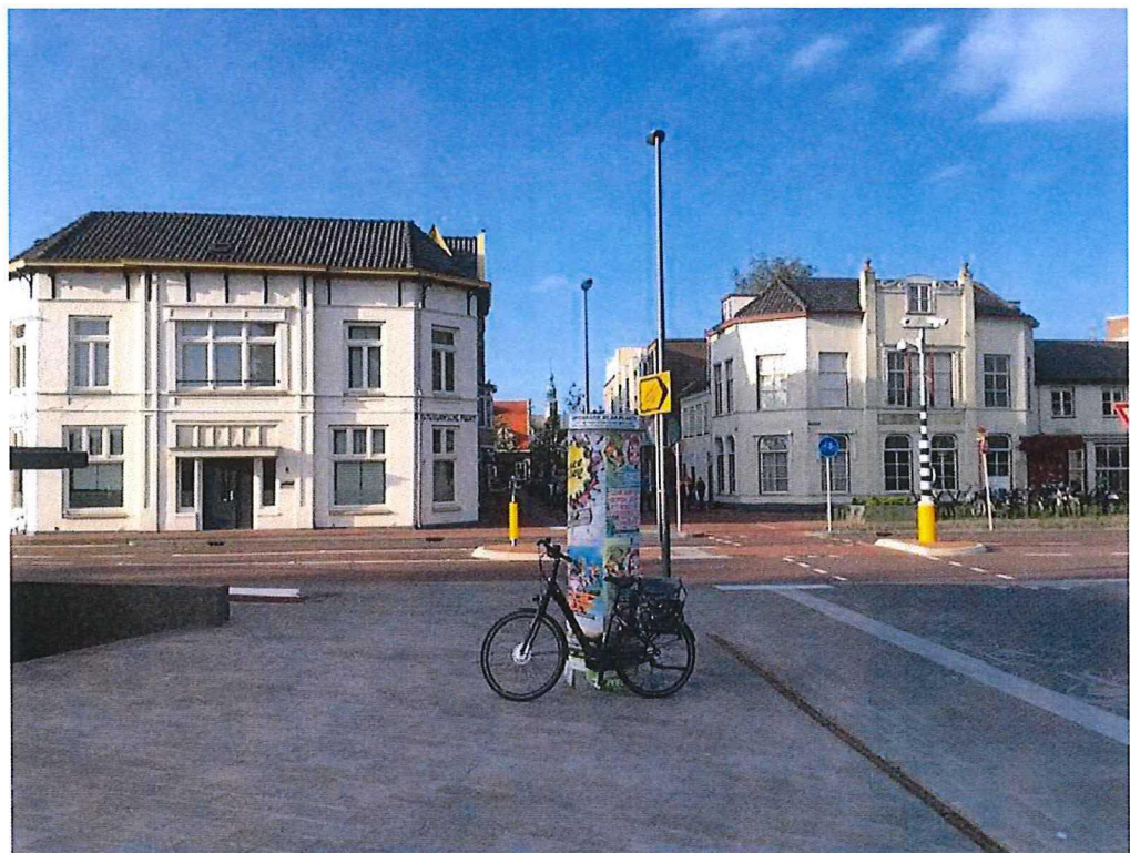
Tramplein 9, Purmerend mei 2015