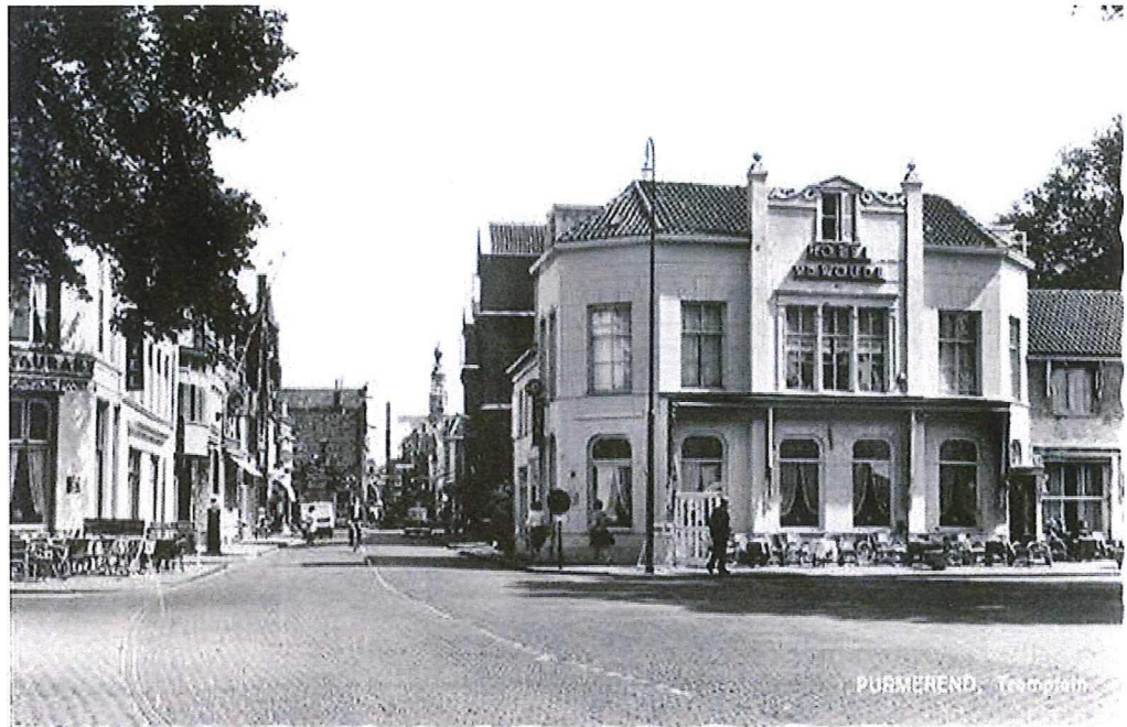
Tramplein 9, Purmerend ong. 1960