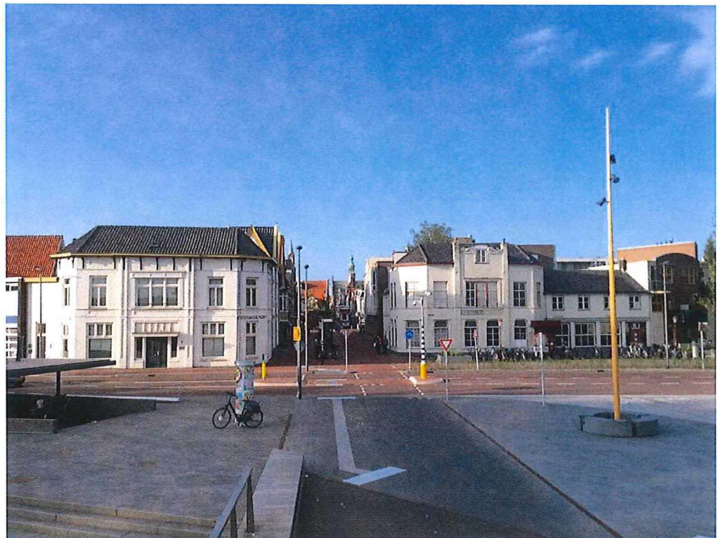
Dit fraaie stadsbeeld mag niet verdwijnen. Tramplein 9, Purmerend juli 2015