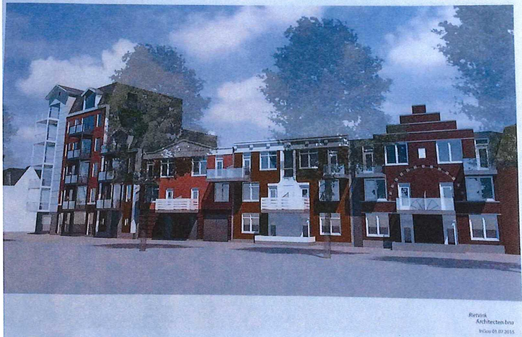
Ontwerp d.d. 01-07-2015 Rietvink Architecten. Tramplein 9, met gevelwand aansluitend op de Nieuwe Gracht, Purmerend