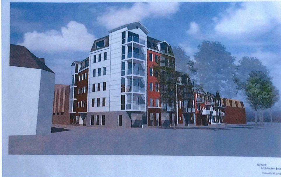
Ontwerp d.d. 01-07-2015 Rietvink Architecten. Tramplein 9, Purmerend